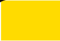
Amarillo No. 17 492