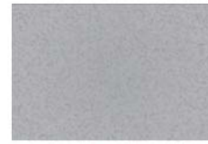
Aluminio No. 3 901