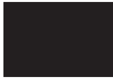
Negro No. 2 800