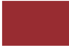
Rojo No. 8 294