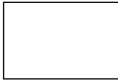
Blanco No. 1 100