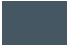
Pizarra No. 27 696