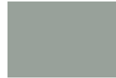
Gris No. 25 892