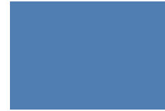
Azul Eléctrico No. 19 691