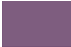
Violeta No. 7 689