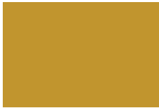
Ocre No. 23 489