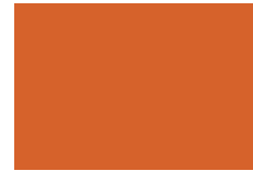
Naranja Oscuro No. 10 391