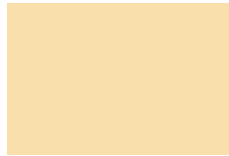
Marfil No. 24 493