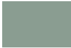
Gris Claro No. 5 891