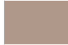
Café Claro No. 22 793