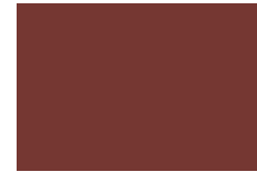
Marrón No. 28 288