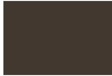
Café Oscuro No. 21 795