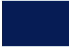
Azul Oscuro No. 18 693